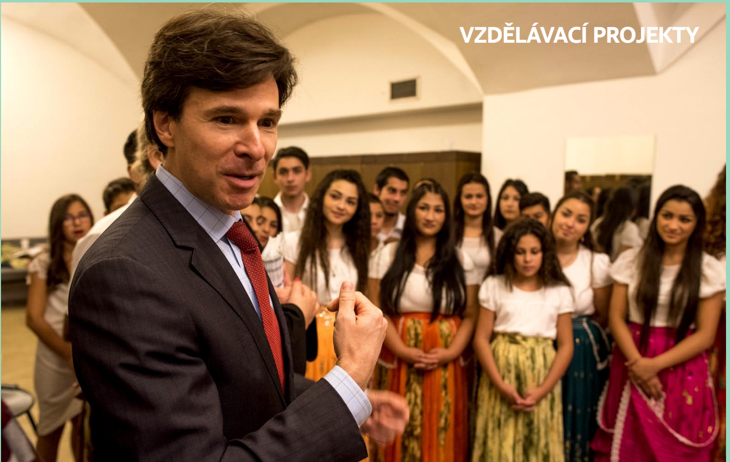
Setkání s americkým velvyslancem