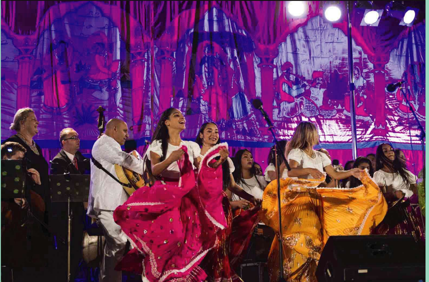
Koncert v Děčíně Koncert v Novém Boru